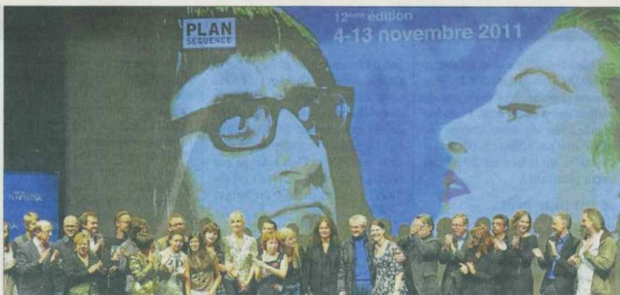
Et le rideau sur l'écran de la 12 e édition de l'Arras Film Festival est tombé...