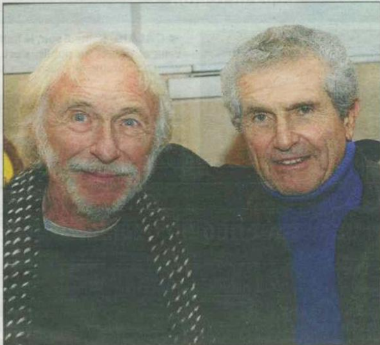
Pierre Richard, venu présenter « Et si on habitait tous ensemble ? » (à voir d'urgence...), a croisé Claude Lelouch.